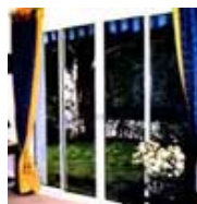
Fenêtres et porte-fenêtres alu

Des modèles variés, issus de plusieurs fabricants de renom, sélectionnés par nos soins pour la qualité de leurs réponses sur les questions d'isolation thermique et phonique ou de sécurité.